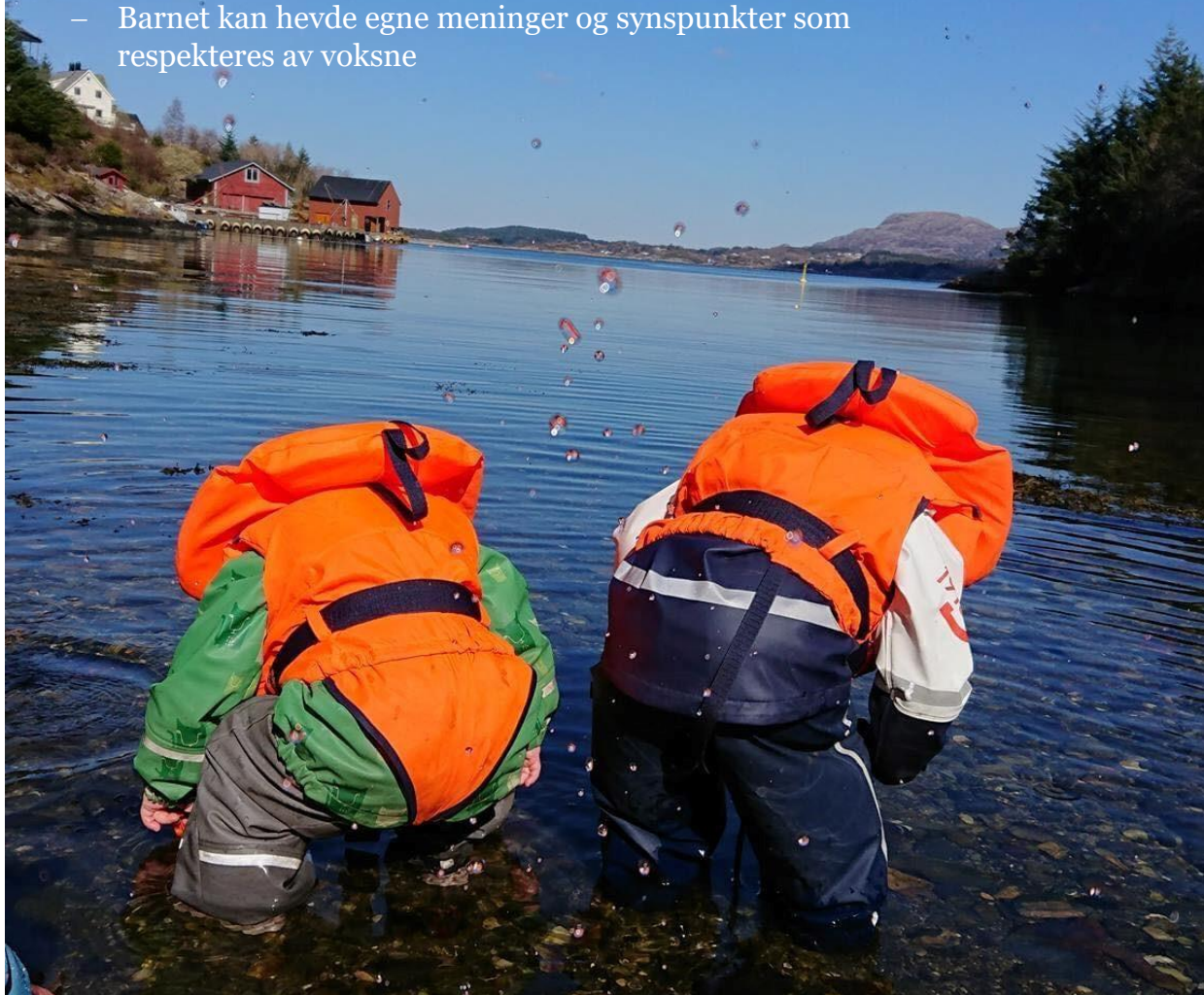
Furehaugen barnehage, barn ved sjø