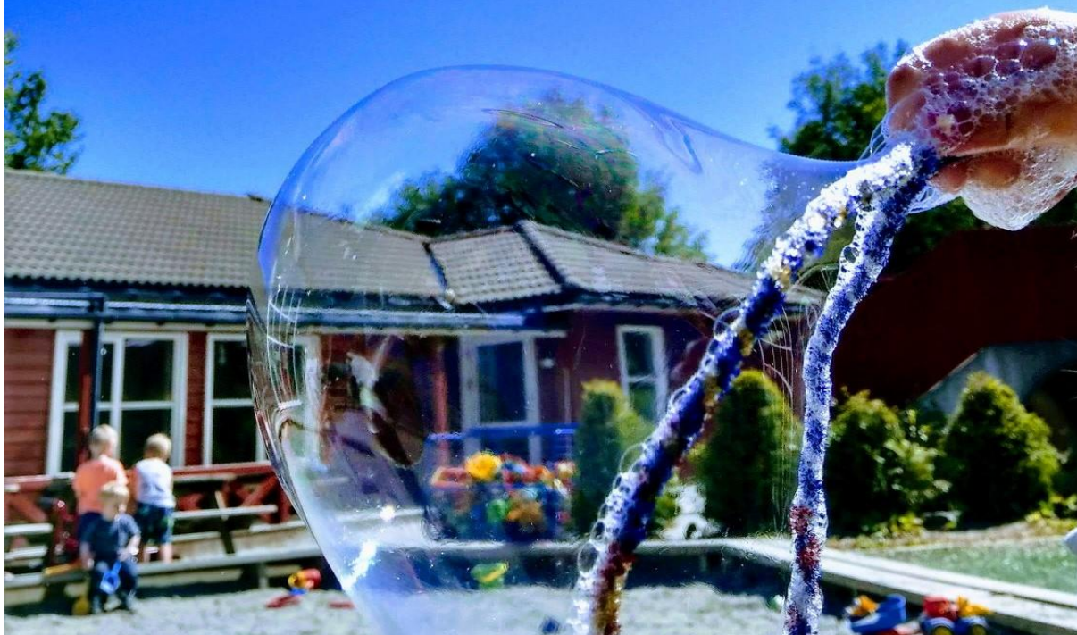
Læringsverkstedet DOJ Nord, såpeboble